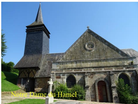
Notre-Dame au Hamel